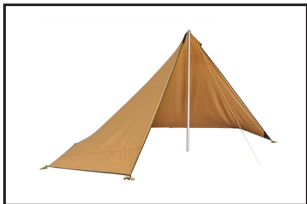
Tarp 5/7 uppsatt som vindskydd

Uppsatt som vindskydd eller helt fristående