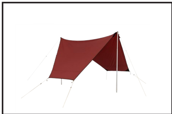
Tarp 5/7 i lättviktsmodell uppsatt fristående

Sätt först en tältspik i bandöglan på sidan mitt emot den med kardborrefäste. Fäst en teleskopstång i öljjetten vid kardborrefästet och justera till lämplig höjd. Fäst linan med en tältspik och spänn linan. Sätt tältspikar längs långsidorna. Tarp 5/7 har bandöglor för två tältspikar på varje sida medan Tarp 7/9 har bandöglor för tre tältspikar på varje sida.