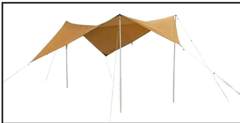
Tarp 7/9 uppsatt fristående